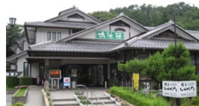
グリーンパーク山東