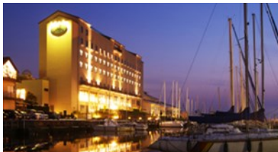
北ビワコホテルグラツィエ